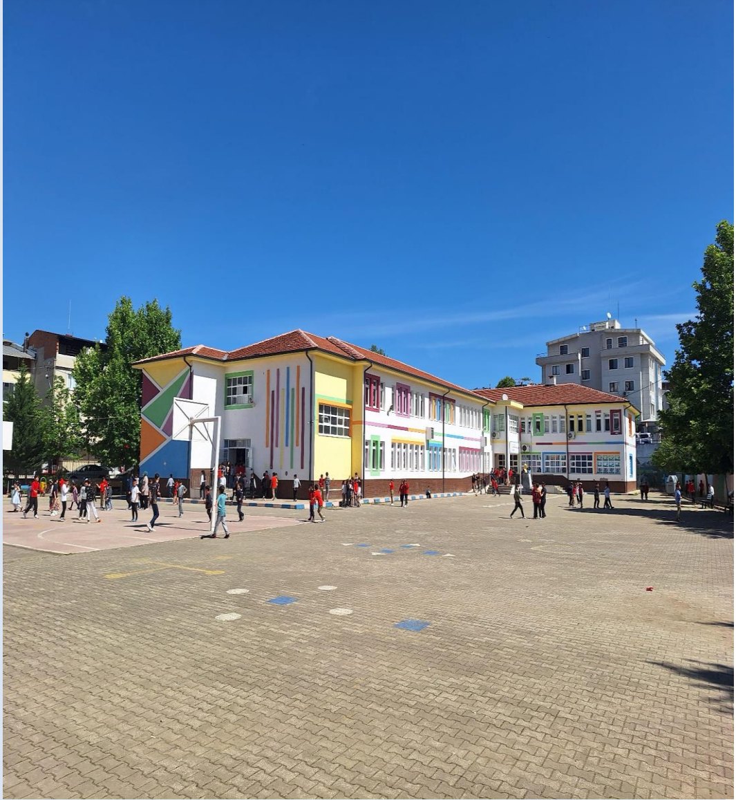
MUSTAFA MÜNEVVER OLAĞANER İLKOKULU