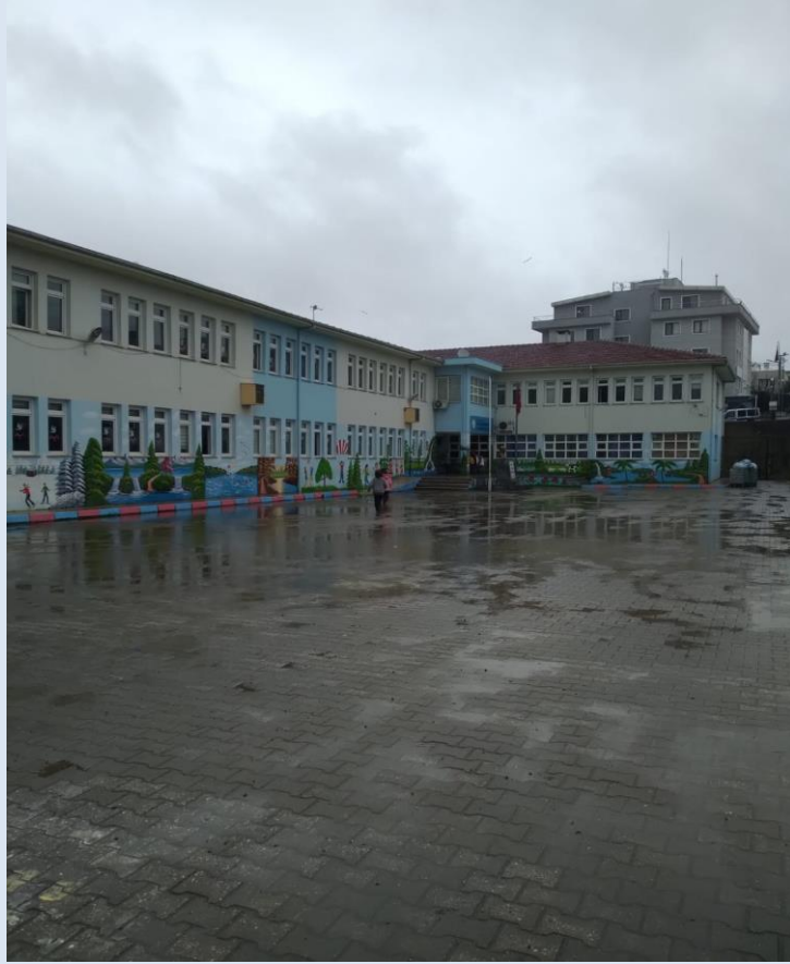
Mustafa Münevver Olağaner İlkokulu